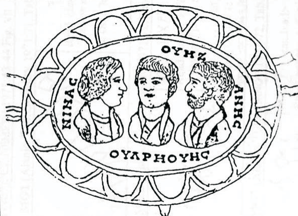
Рис. 4. Инталя из Абхазии (предположительно III–IV вв. н.э.) с портретными изображениями трех персонажей: Нины (слева), Улривиса (в центре), Узаниса (справа). Варианты чтения: Нина, Виз (вверху), Анис (справа) и Улривис (внизу) как родовое имя [16, с. 168; 61, р. 196]. Ср. у Г.Ф. Турчанинова, читавшего надпись по-осетински: «Нина есть – ее семейство есть – на груди есть» [52, с. 157–158]

шительный перелом. Советские историки связывают этот сдвиг с наступлением феодальных отношений [17, с. 8, 114]. Сейчас на этот вопрос смотрят шире и включают в число факторов, определивших особый характер кавказской цивилизации, прежде всего христианизацию всех основных кавказских народов (Армении, Иберии, Албании), появление оригинальной письменности и литературы [6]. Причем, по мнению современного исследователя, «чаще всего инициаторами крещения становилась не Византия, а сами варварские правители, которые надеялись путем христианизации попасть в сообщество цивилизованных стран» [19, с. 332]. Со стороны Восточного Рима (Византии) христианизация носила стихийный характер и осуществлялась не столько усилиями императорского или церковного руководства, сколько активностью самих христиан, связанных с Кавказом. Христианизация Иберии (Грузии) ок. 337 г. н.э., как известно, началась с того, что попавшая в плен каппадокиянка Нина «убедила вождя этого народа послать к римскому императору и просить, чтобы был им отправлен учитель благочестия» (Theodoretus HE, p. 76) [19, с. 45]. Христианство в Армению (314 г. н.э., как наиболее вероятная дата) занес малоазийский резидент из Кесарии Григорий Просветитель, активный проповедник и в других областях Кавказа. Все это указывает на плодотворность контактов римских подданных и кавказцев, которые в