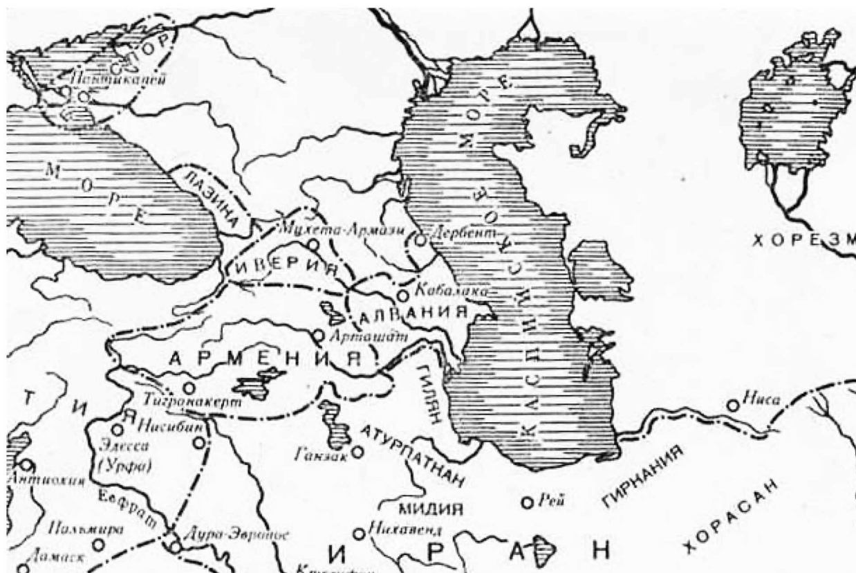
Рис. 2. Кавказ в IV веке н.э.

До войн с понтийским царем Митридатом VI Евпатором (121–63 гг. до н.э.) римляне имели довольно смутные сведения о Кавказском регионе. Лукулл был первым полководцем, прошедшим земли Великой Армении (69–68 гг. до н.э.), а Помпей – территорию Албании, Иберии, Колхиды от Каспийского до Черного морей (65 г. до н.э.). Необходимость изучения театра войны потребовала знакомства с географией, этнографией, историей, политическим и общественным строем местных народов. Неудивительно, что со времен римского присутствия знания о Кавказе значительно пополнились. Страбон, Плиний Старший, Тацит, Флавий Арриан, Кассий Дион, писатели «Историй августов», Аммиан Марцелин оставили интересные наблюдения и зарисов-