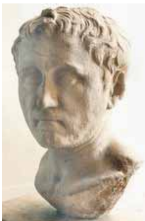
Рис. 1. Помпей Магн. Первый римский полководец, дошедший до Кавказских гор в 65 г. до н.э. Лувр, Париж

сложную картину римско-кавказских отношений, скорее благоприятствующих, нежели препятствующих развитию местных обществ и народов. Правда, нужно сделать оговорку, что имеющийся в нашем распоряжении письменные источники преимущественно греко-римского происхождения, и отражают, в основном, римскую точку зре-