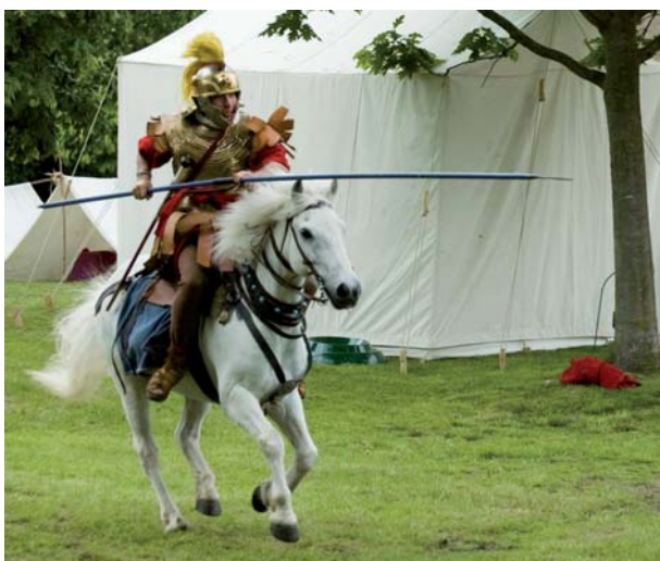
Рис. 8–12. Адаптация сарматских боевых приемов римскими конниками. Военно-исторический клуб Comitatus (Великобритания)

с контосами (сарматы против парфян в 35 г. н. э.), имеется пять ее описаний – не всесторонних, конечно (авторы не знали, что две тысячи лет спустя появятся столь требовательные к деталям читатели), но достаточно ясных: два – у Тацита (в «Истории» и «Анналах»), а также у Валерия Флакка, Силия и Стация (подробнее: [15, с. 69–72]). Это помимо самого Арриана! Мало? А много ли вы найдете подробных описаний использования любого другого копья: гасты, ланцеи, пилума? Про кавалерийскую сариссу македонцев – ни одного (кроме названия «сариссофоры»), и до сих пор идут споры, одной