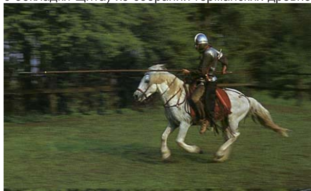
Рис. 3. Атака римского контария (по М. Юнкельману)

только подъезжающего к месту предполагаемой схватки, поэтому пика у него поднята под углом наконечником вверх (т. е. нет признаков с 5-го по 8-й). Перевести контос из подготовительного в боевое положение – дело нескольких секунд. Но по формальным признакам памятник отсеивается. 3) Излишнее доверие докладчика к самому себе при интерпретации изображений может подвести. Все-таки нужно присмотреться (не обязательно соглашаться, но принять во внимание) и к аргументам с другой стороны, тем более, что там мы встречаем знатоков древнего искусства, таких как Ростовцев и Блататский. Опытный глаз специалиста может подметить то, что пропустит человек, мало работающий с конкретной группой источников. Именно по этой причине я, не будучи специалистом в раннем западном средневековье, при идентификации двуручного хвата копья у двух фигурок всадников (фибула с Одним и фигурка лангобардского всадника с обкладки щита) из собраний германских древно-