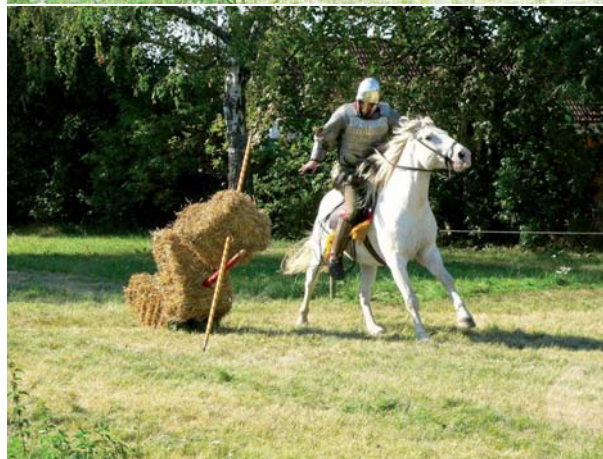
Рис 5–7 Атака контария по-сарматски. Аспарн-ан-дер-Цайя (Австрия), 2008 год. Asparn/Zaya2008 https://www.facebook.com/Timetrotter/photos/a.271036609613606.87193.229353347115266/712400912143838/?type=1&theater