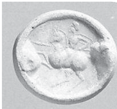
Рис. 2. Оттиск парфянской печати (3 в. до н.э – 3в. н.э.). Метрополитен-музей.

показывает надгробие катафрактария-клибанария из вифинского Клавдиополиса [35]: это к тому, что 2-й признак не следует искать на римских изображениях конных контариев. Дельное замечание сделал Хлевов (1.14:30): нужно учитывать, какую фазу атаки передает художник. Например, рельеф Трифона явно показывает всадника,