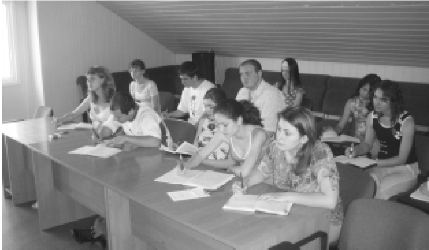
Слушатели математической школы

В одном из живописнейших ущелий Северной Осетии на берегу реки Фиагдон расположился молодежный краеведческо-туристический центр Барс. С 5 по 9 июля 2007 года «Барс» гостеприимно распахнул свои двери для участников Владикавказской молодежной математической школы. Школа была организована с целью более углубленного изучения некоторых разделов функционального анализа, повышения уровня знаний увлеченной научной деятельностью молодежи.