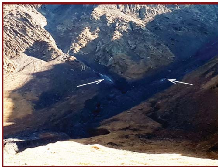
Фото 5. Заморенные льды под г. Заккахох, вскрытые селом в июле.

Малые формы оледенения обычно заканчива-