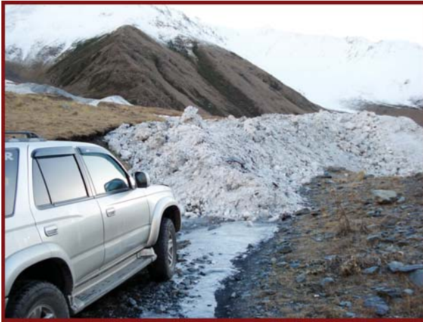
Фото 2. Лавина перекрыла дорогу к Хилакским источникам.

1,6 км, ширина 0,8 км, крутизна 12°. Верхняя часть конуса выноса находится на высоте 2 650 м. Над конусом выноса расположен скальный массив высотой до 3 709,5 м (вершина горы Заккахох). Он расчленен несколькими кулуарами, сходящимися на верхней части конуса выноса (фото 1). Отсюда сходит одна из первых лавин этого ущелья и полностью перекрывает дорогу (фото 2). Но самое сильное разрушение дороги на этом же месте происходит при сходе селевых потоков. Так, со слов пограничников, в сентябре 2014 г. при хорошей погоде этот сель сходил 4 или 5 раз. Селевой поток смыл дорогу, а его отложения образовали подпруды на реке Бугултадон. Из-за подпруды реки под развалинами селения Калотыкау образовалось озеро. По нашим промерам, проведенным 9 ноября 2014 г., этот сель смыл дорогу на протяжении 9 м, а селевое врез был глубиной до 5 метров. Образовавшееся озеро было длиной 118 м, шириной до 45 м, глубиной до 2 м (фото 3, левое). Координаты озера в системе VGS-84: 42°43'07" СШ, 44°12'38" ВД. Отложения селя в русле р. Бугултадон вниз по тече-