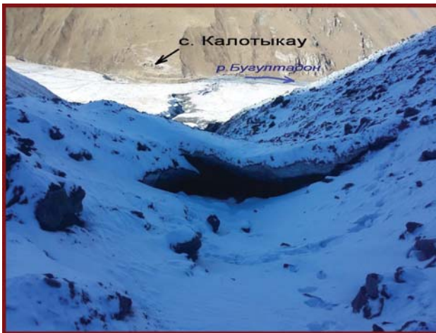
Фото 7. Ледниковый нисходящий грот на конусе выноса.

ются на большой высоте. А этот ледник опускается до высоты 2 560 м. На территории Северной Осетии это самый низко опускающийся ледник малой формы оледенения. Главная причина замедленного отступления этого ледника – сплошная поверхностная морена, являющаяся мощным теплоизолятором.