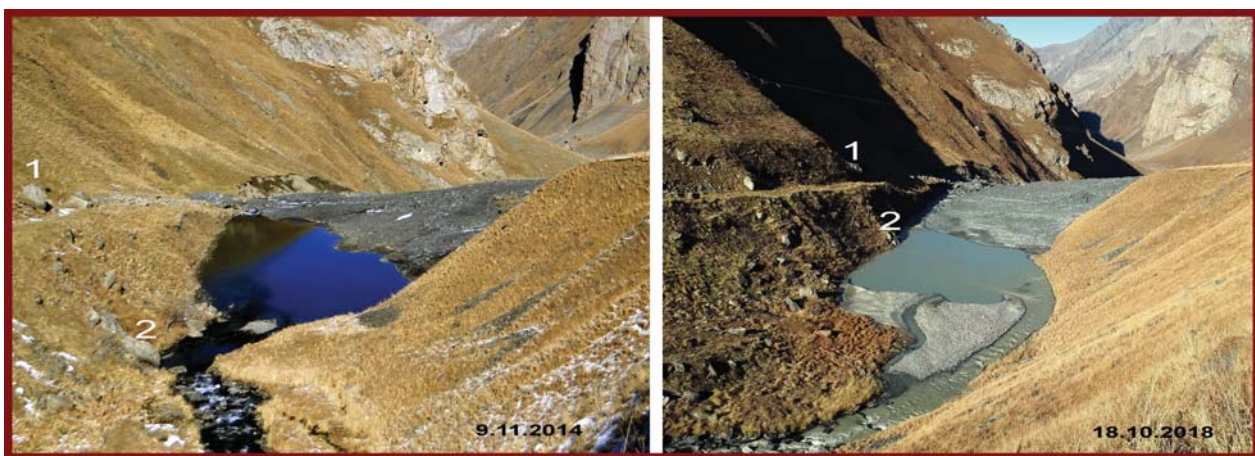
Фото 3. Озеро под развалинами с. Калотыкау в разные годы. Одинаковыми цифрами обозначены одни и те же ориентиры.

Во время этой поездки прямо с дороги была произведена фотосъемка нескольких участков селевого вреза. В последующие дни при рассмотрении этих фотографий мы увидели в очаге зарождения селевого потока белые элементы на фоне черных селевых масс (фото 5). Возникло предположение, что там находится неизвестный, полностью забро-