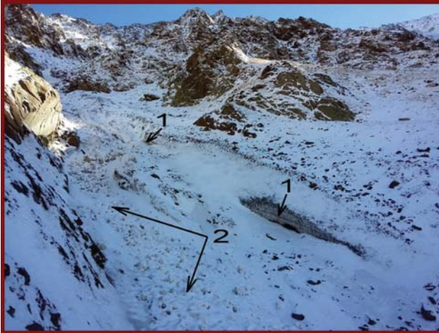
Фото 6. Вскрытые селем слои льда – 1, и глыбы ледового обвала – 2.