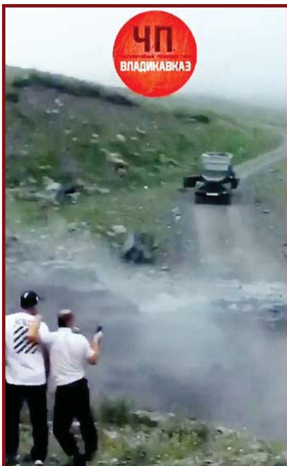
Фото 4. Сход селевого потока 1.07.2018 г.

нированный поверхностной мореной ледник, при таянии которого из-за жаркой погоды могло образоваться большое количество воды. Эти талые воды и могли вызвать сход селевого потока.