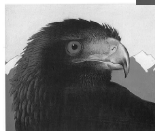
ЖИВОТНЫЙ МИР Республики Северная Осетия-Алания